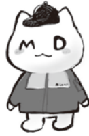
▲ 公式キャラクター 「みなっち」