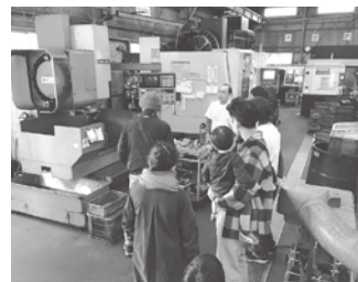
普段見せないものづくりの現場を公開