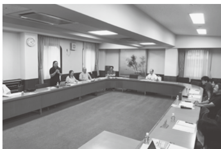
▲青梅市長と今後の青梅市について意見交換を行いました

大勢待市長からは、市長になって感じたことや、市の強みについて話があり、若手経営者からは市への要望など、今後の青梅市を担う世代からの意見を伝えました。