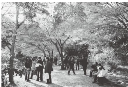
▲自然が多くきれいなまち、青梅・奥多摩の魅力発信にご協力ください!

青梅・奥多摩は東京で最も標高が高く、北に位置するため、東京では一番初めに紅葉を楽しめる地域です。地域による高低差で、長い期間各エリアの紅葉を楽しむことができます。地の利を生かした観光戦略として、地域の9つの団体が『青梅・奥多摩もみじ協定』を締結し、各地へ観光客が訪れるように広く周知を行っています。今年度も紅葉シーズンを迎えるにあたり、広報活動に力を入れています。今年「奥多摩から始まる東京の秋」のキャッチコピーで、ポスターを都内23区の駅構内や、青梅・奥多摩エリアに掲示し、2024年度の観光客増加を目指して活動していきます。地域全体で紅葉シーズンを盛り上げましょう!