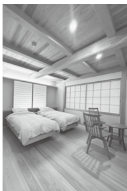
▲リニューアル後の定員2名の洋室