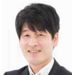
NPO法人ファザーリング・ジャパン副代表理事 パパライフサポート代表

大学卒業後、化粧品会社および専門商社を経て平成10年、社会保険労務士試験に合格。平成18年から4年間、厚生労働省東京労働局にて次世代法(くるみん)を担当。平成22年、社労士法人グレースを開業し現在に至る。(株)グレースでは研修およびコンサルティングを実施。