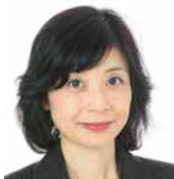
社会保険労務士法人グレース代表 特定社会保険労務士