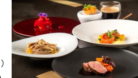
イタリアンコース『Festa Italiana』