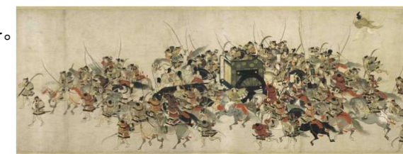
作品名 《平治物語絵巻 三条殿夜討巻》(部分) 制作年 鎌倉時代、13世紀後半

販売枚数 各 20枚 (先着順・なくなり次第終了) 枚数制限 会員及びその家族の合計人数分 購入方法 窓口にて現金と引き換えにお渡しします。 販売期間 3/13(金)～6/12(金) まで